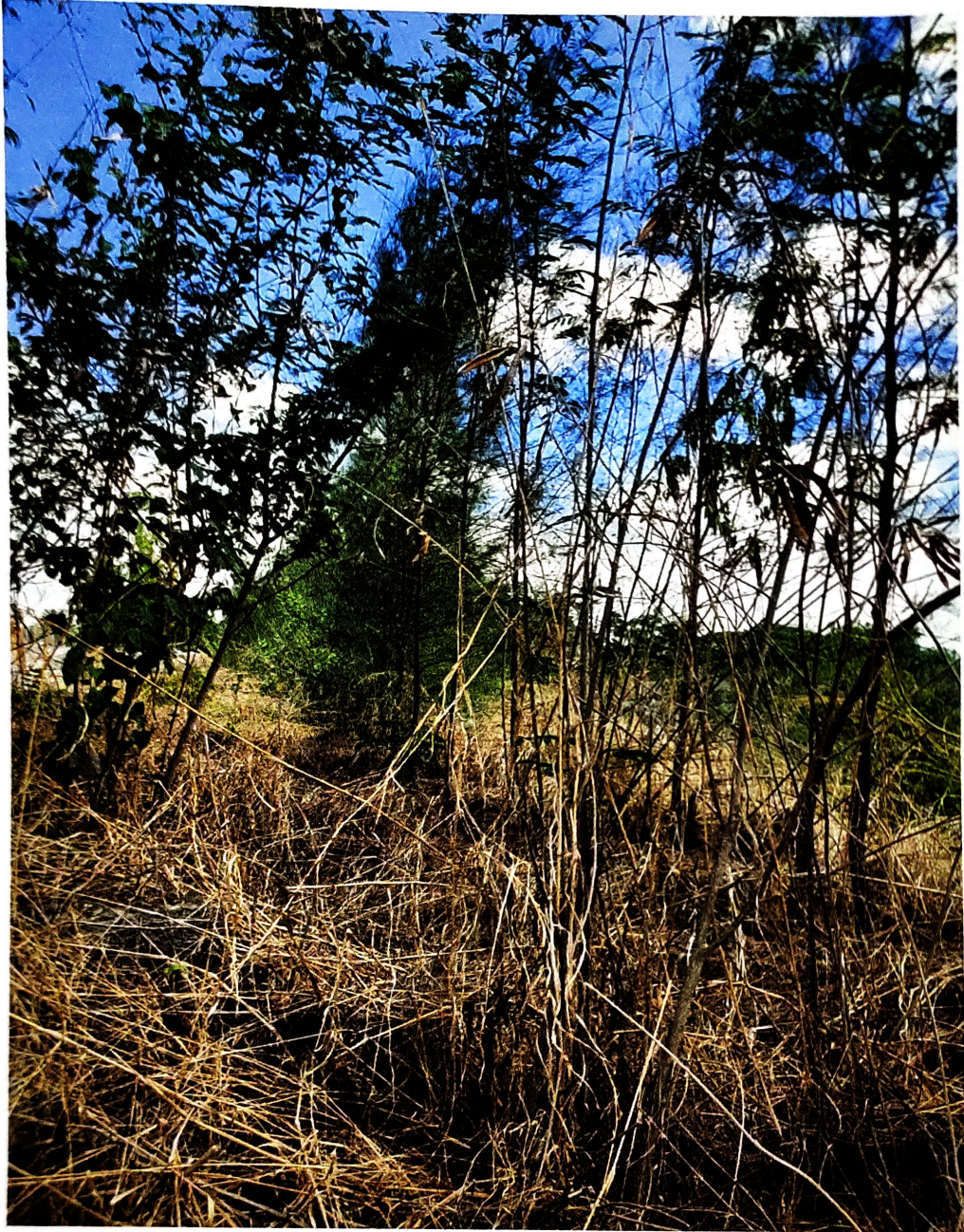
ดูแลต้นไม้รอบประธานบัตร