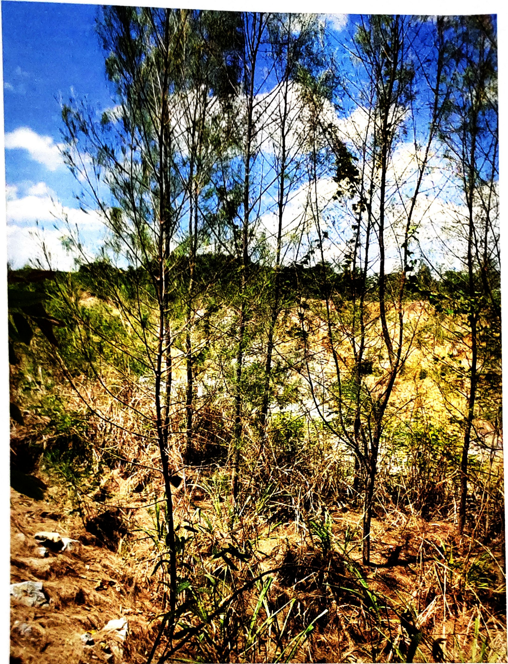
ดูแลต้นไม้รอบพระตำหนัก