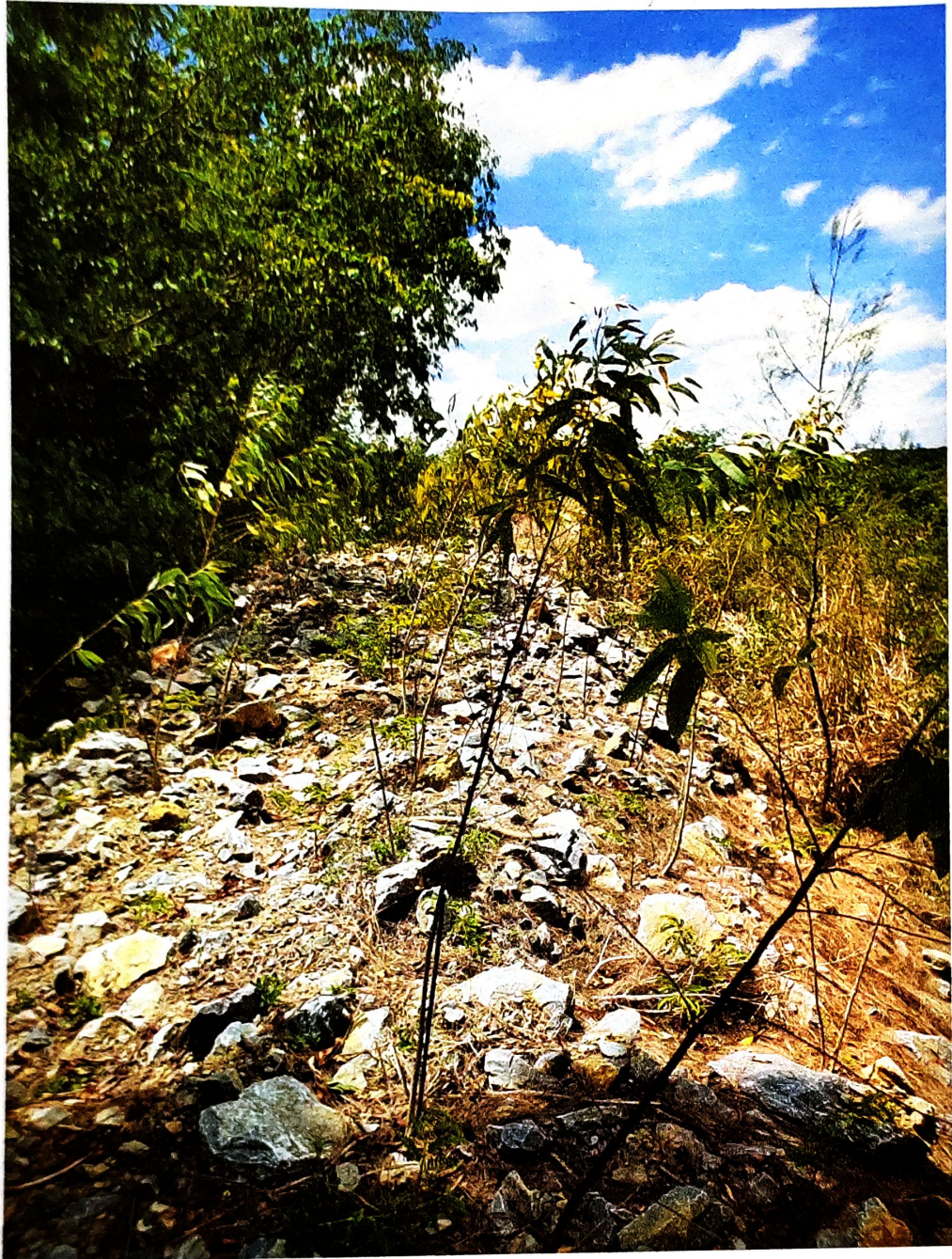
ดูแลต้นไม้รอบพระตำหนัก